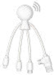
Blanc white XP71024.14NFC

Câble multi-connecteurs connecté XP71024